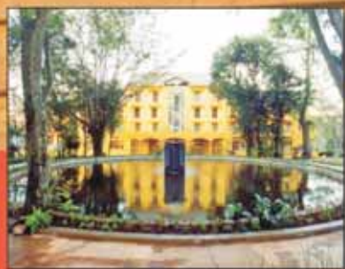
Hotel Paradies, em Jarinu