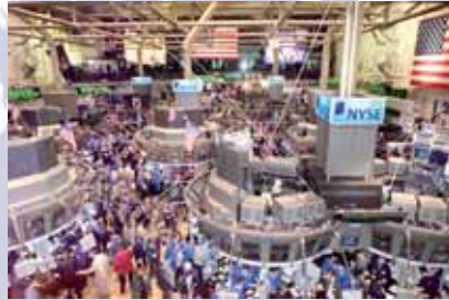
Bolsa de NY: medo e pânico